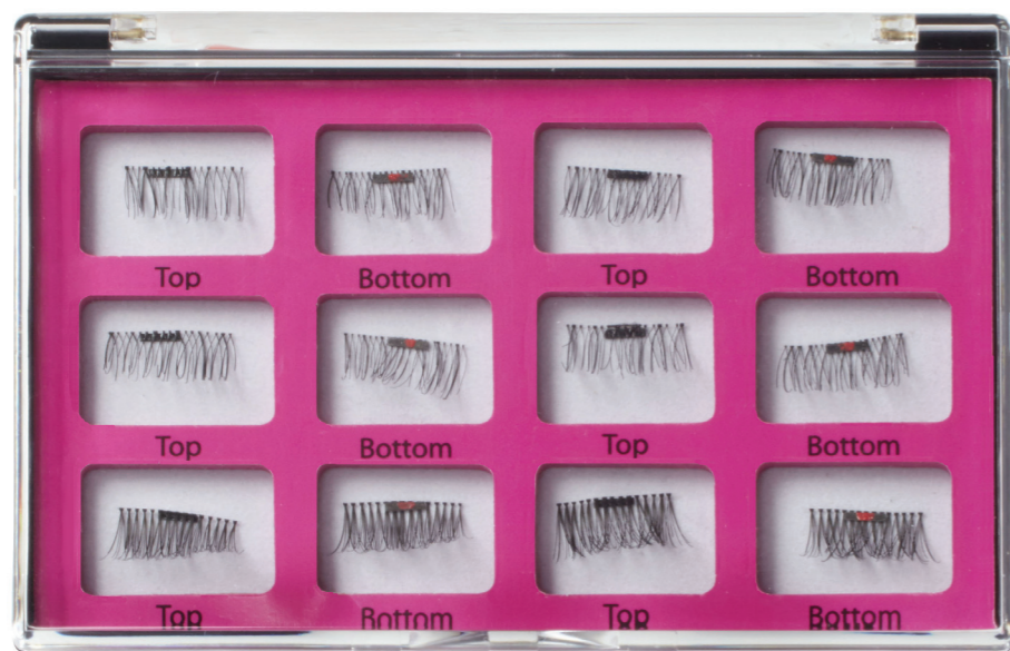
BOÎTIER DE RANGEMENT